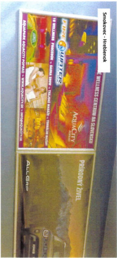
Smokovec - Hrebienok