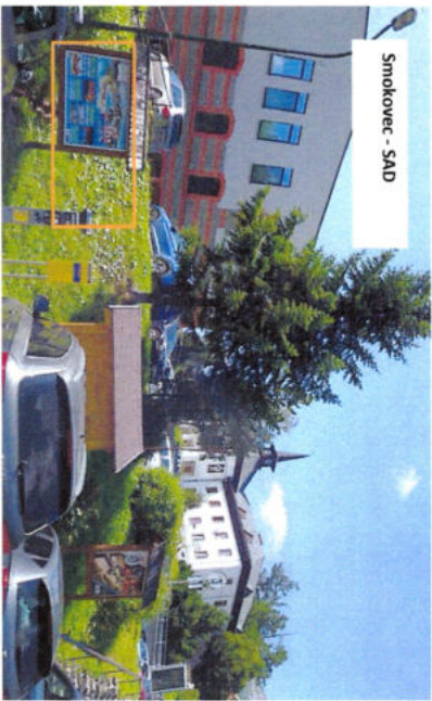
Smokovec - SAD