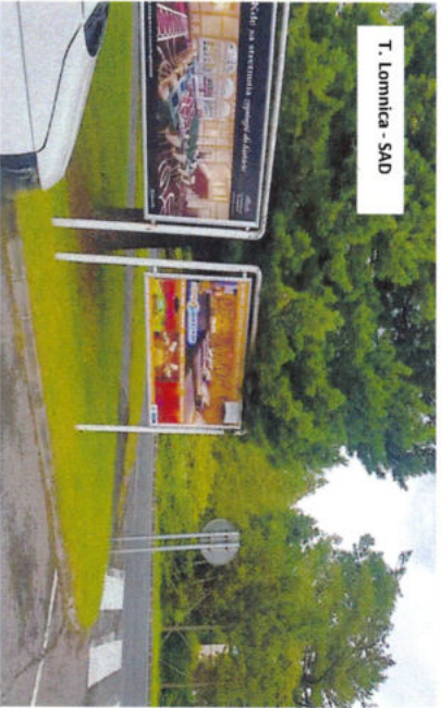
T. Lomnica - SAD