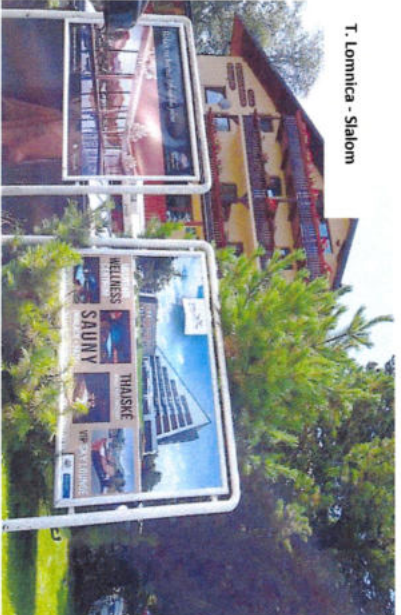
T. Lomnica - Stalom