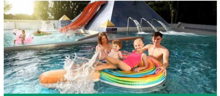
13. 7. - 1. 9. 2024, AQUACITY POPRAD

Užite si bohatý letný program vo Vysokých Tatrách, kde si na svoje príde každý návštevník. Utorky a štvrtky sa môžete tešiť na koncerty, piatky budú patriť letnému kinu a nedele vás zabavia divadelné predstavenia. | Enjoy a variety of summer programmes in the High Tatras. There will be concerts on Tuesdays and Thursdays, summer film screening on Fridays and theatre performances on Sundays.