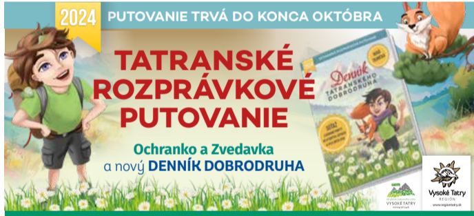
1. 6. 2024 - 31. 10. 2024, VYSOKÉ TATRY

Pokojná hladina Štrbského plesa sa premení na „tatranské Benátky“. Zažite podujatie plné romantiky a bohatého programu. Atmosféru večera budú dotvárať dobové barokové kostýmy, atraktívne zrkadlové sochy a výnimočný hudobný program. | The tranquil waters of Štrbské pleso (tarn) will transform into „Tatra Venice.“ Experience an event filled with romance and a varied programme. The evening's atmosphere will be enhanced by period baroque costumes, attractive mirrored sculptures and an exceptional musical programme.