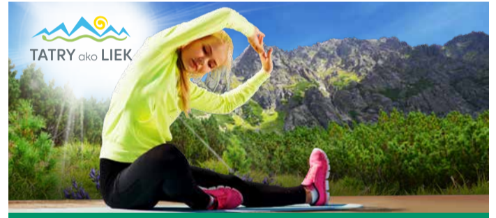
JÚL - AUGUST 2024, VYSOKÉ TATRY

Letné osvieženie, horúce slnko a jedinečná zábava pri denných animačných a víkendových programoch pre deti a dospelých. Koncerty, tanečné vystúpenia, detské programy, autogramiády, penové párty, zažite zábavné leto v AquaCity Poprad. | Summer refreshment, hot sun and great fun with daily activities and weekend programmes for all age groups. Concerts, dance shows, kid's activities, autograph shows, foam parties. Enjoy an amusing summer at AquaCity Poprad.