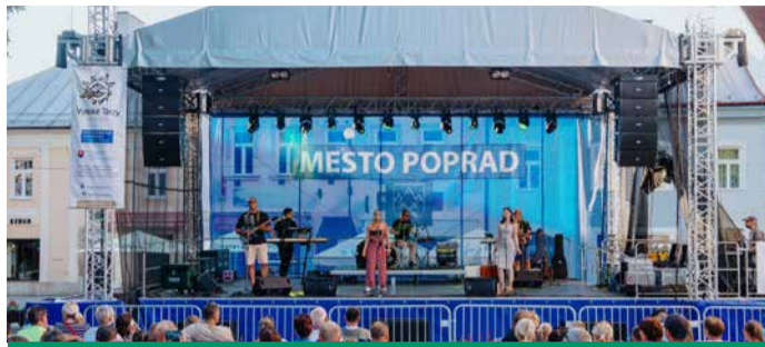
28. 6. - 30. 8. 2024, POPRAD