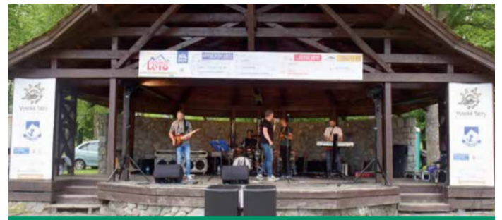
22. 6. - 1. 9. 2024, TATRANSKÁ LOMNICA, KÚPELE NOVÝ SMOKOVEC